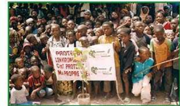
Journée de sensibilisation des élèves du groupe scolaire Artillerie de Ouagadougou (Sect.30)