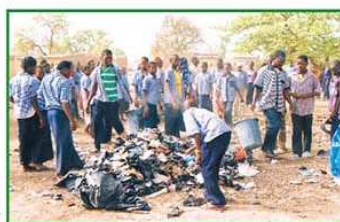
◀ Sensibilisation des élèves de l'école EL BETHEL de Yagma sur les dangers du sachet plastique