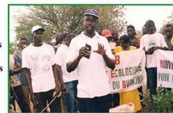
◀ L'importance des arbres expliquée à la population de Tiibin (Yako)