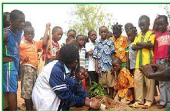
◀ Comment bien planter un arbre avec les élèves du Groupe Scolaire l'ACADEMIE de Ouagadougou.