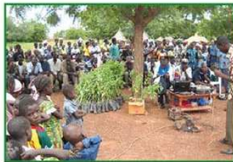
◀ Sensibilisation et don de plants à la population du village de Tiibin (Yako)