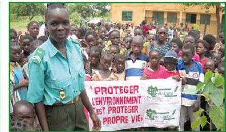
Journée de sensibilisation des élèves de l'école primaire de Ouarmini